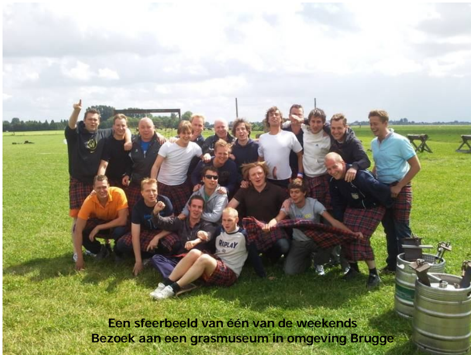
Een sfeerbeeld van één van de weekends Bezoek aan een grasmuseum in omgeving Brugge